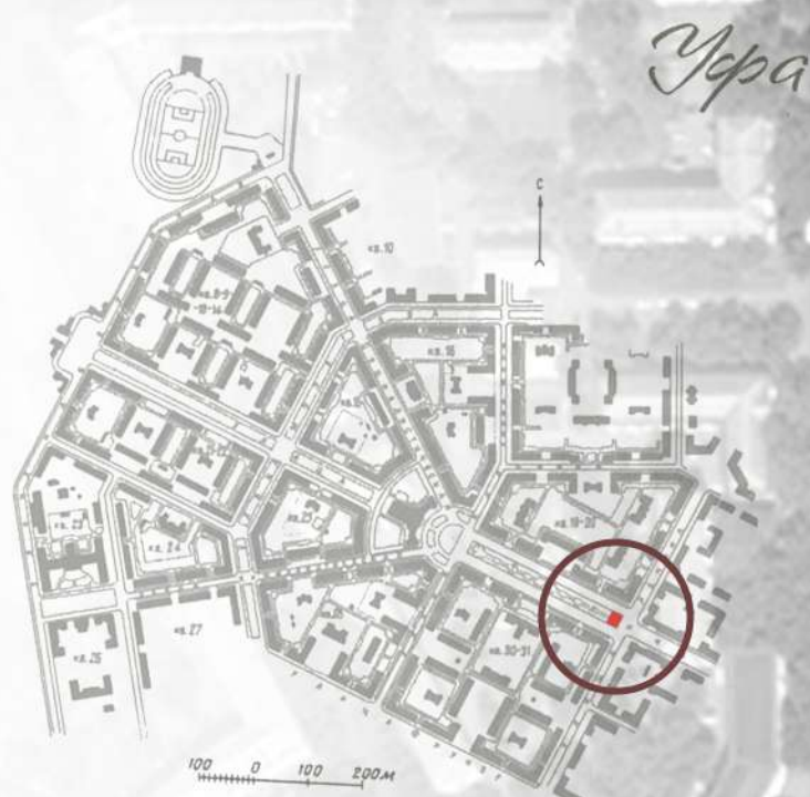
Уфа Схема планировки Орджоникидзевского и Калининского районов